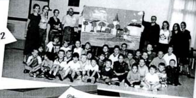
Cinquantenaire de L'école et de la mairie