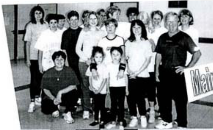
Maintien en forme